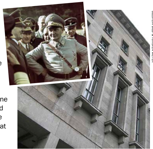
Bag disse vinduer styrede Göring det tyske Luftwaffe. I dag huser bygningen det tyske finansministerium.

Göring viste sig at være den forkerte mand på posten. Luftslaget om England mislykkedes (1940), og løftet om at forsyne de 200.000 omringede tyske soldater ved Stalingrad fra luften kunne han heller ikke holde (1943). Men Göring reagerede ved at give sine piloter skylden for fiaskoen.