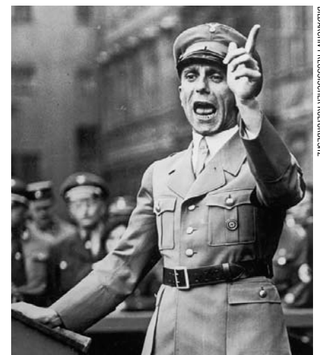
Efter Hitlers død blev Goebbels Tysklands nye leder. Han begik selvmord dagen efter.

virkningsfulde formuleringer. Den 18. februar 1943 var alt klar, så han kunne spørge tyskerne, om de ønskede "den totale krig". Talen blev transmitteret direkte i radioen, så hele befolkningen kunne blive overbevist af det tordnende bifald, Goebbels høstede. Hvad lytterne ikke kunne vide, var, at tilhørerne i den store sportshal var nøje udvalgt.