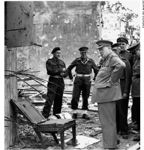
Winston Churchill så førerbunkeren under et besøg i Berlin 1945.

Den nøjagtige placering af Hitlers sidste tilholdssted blev længe holdt hemmelig, men som en service for de mange gæster til fodbold-VM i 2006 besluttede bystyret at tillade opstillingen af en informationstavle på stedet. Det er historiens ironi, at førerbunkeren er blevet nabo til de mange betonsøjler, der udgør mindesmærket for Europas myrdede jøder.