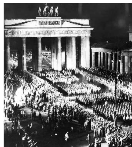
Den 30. januar 1933 fik Hitler magten. Begivenheden blev fejret med et fakkeltog fra byens vartegn, Brandenburger Tor.