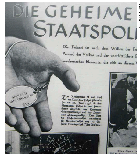
En udstilling i Gestapohovedkvarterets kælder fortæller om det hemmelige politis arbejde.

Gaden hedder i dag Niederkirchnerstrasse, opkaldt efter en kvindelig, kommunistisk modstandskæmper.