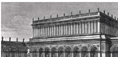
Domus Aurea var et af historiens største paladser med sine 300 værelser.

Nero boede i Domus Aurea under et år, inden hans efterfølgere lagde paladset i ruiner og byggede ovenpå.