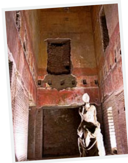
Lofter og vægge i Domus Aurea var pyntet med bl.a. ædelsten, elfenben og farverige freskoer.