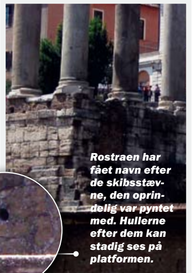
Rostraen har fået navn efter de skibsstævne, den oprindeligt var pyntet med. Hullerne efter dem kan stadig ses på platformen.