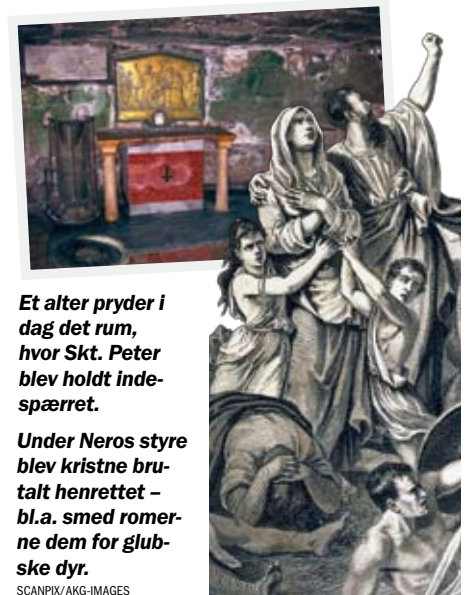
Et alter pryder i dag det rum, hvor Skt. Peter blev holdt indespærret.

Peters fængsel befinder sig nu under San Giuseppe dei Falegnami-kirken nær Forum Romanum. Adgang er gratis, men besøgende forventes at smide nogle mønter i kirkens indsamlingsbøsse.